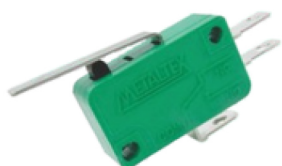
TABELA DE DADOS TÉCNICOS - TC3000

Dispositivo opcional que otimiza o funcionamento da Cortina de Ar em conjunto com a porta instalada de abertura automática.